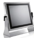
Table Mount オプションのテーブル固定金具