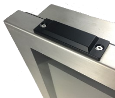
フラット・タイプの無線 LAN アンテナ